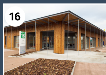
UNITÉ VICHY EST