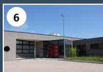
UNITÉ VICHY OUEST